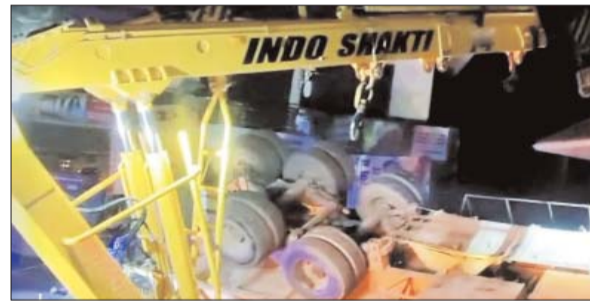
जाही को बंद करने की मांग कर रहे थे। प्राप्त जानकारी के अनुसार मृतक बच्चे की पहचान अंबाला निवासी मंदिर के रूप में हुई है। पुलिस की जांच में सामने आया कि यह घटना सुबह करीब 4 बजे हुई, जब परिवार

हादसे के बाद कालका वासी स्तब्ध हैं और भारी वाहनों की आवा-